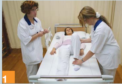
1 Aufstellen des Beines