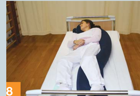
8 Optimale 30°-Lagerung