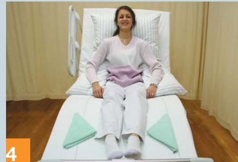
4 Zur Entlastung der Fersen können Sie Handtücher folgendermaßen benutzen ...