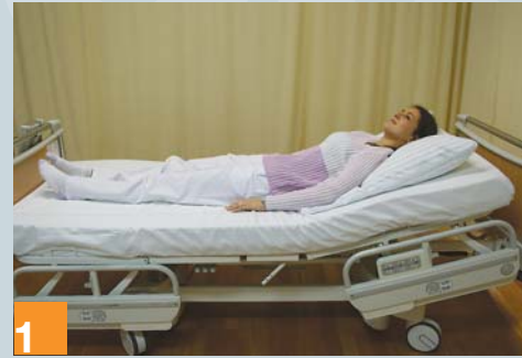
1 Ausgangsposition mittig im Bett