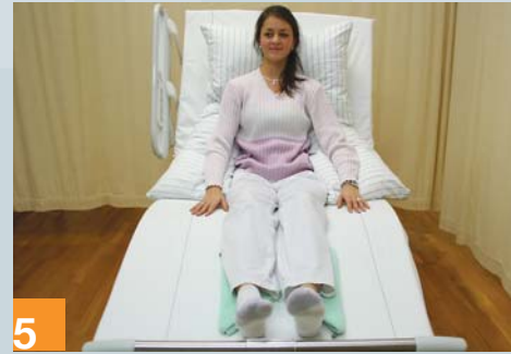
5 Achtung ...