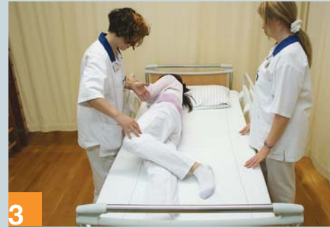
3 Unterstützen Sie bei Bedarf den Pflegebedürftigen und geben Sie ihm Sicherheit.