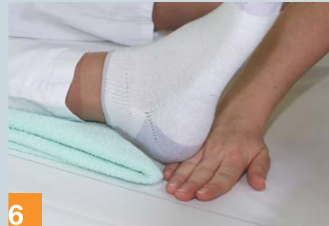
6 ... Fersen frei lagern