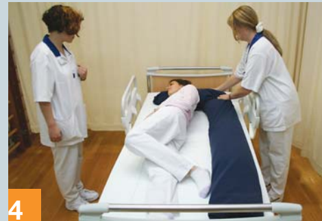
4 Unterstützen Sie die Lagerung mit der Rolle oder einer Decke.