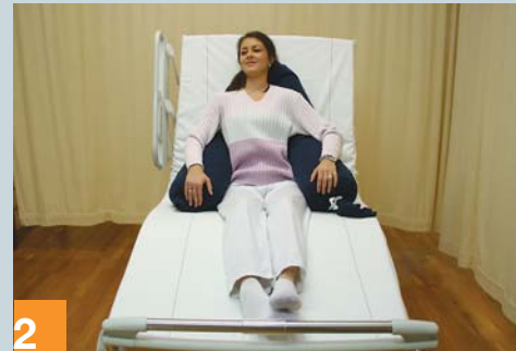
2 Sitzposition nach Funktionalität des Bettes; Lagerungsrolle in A-Position bringen ...