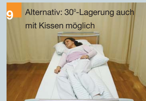
9 Alternativ: 30°-Lagerung auch mit Kissen möglich