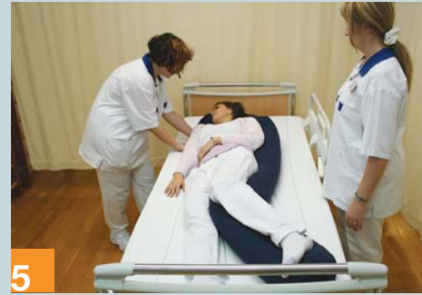
5 Kontrollieren Sie die Lage der Schultern ...