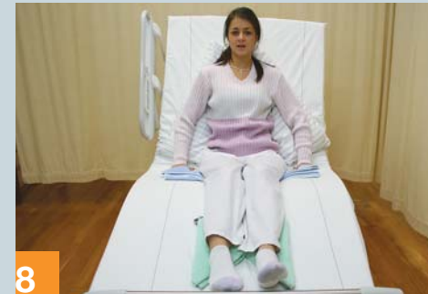
8 Optimale Sitzposition