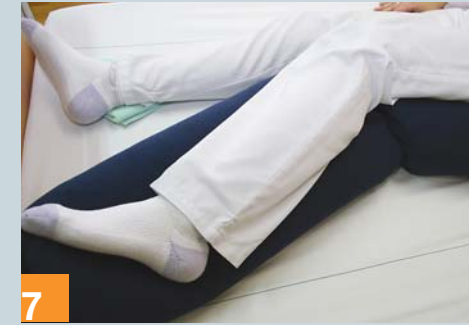
7 Achtung: Fersenfreilagerung