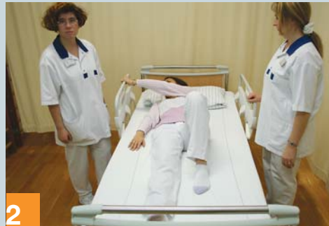
2 Nutzen Sie - wenn möglich - die individuellen Fähigkeiten des Pflegebedürftigen.