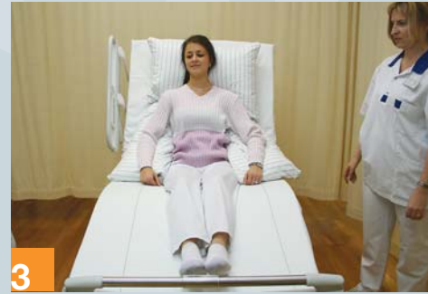
3 ... Unterstützung dieser Position ist auch mit Kissen möglich