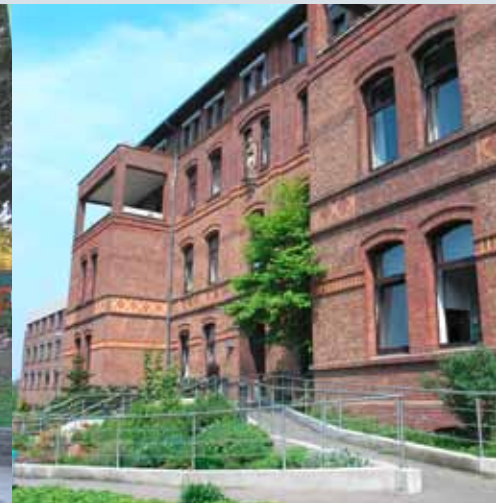
St. Vincenz Krankenhaus